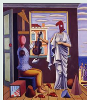
Nikos Engonopoulos, Poète et la muse [Ποιητής και Μούσα] , 1938, huile sur toile

Le Conseil administratif de l'APF f.u.-Grèce vise une éducation holistique qui puisse garantir l'harmonie et la symétrie dans la formation de l'enseignant de français. Nous invitons toutes et tous à œuvrer ensemble en faveur de notre vie professionnelle et personnelle.